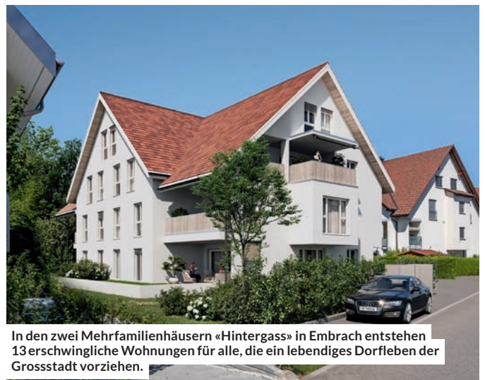
In den zwei Mehrfamilienhäusern «Hintergass» in Embrach entstehen 13 erschwingliche Wohnungen für alle, die ein lebendiges Dorfleben der Grosstadt vorziehen.