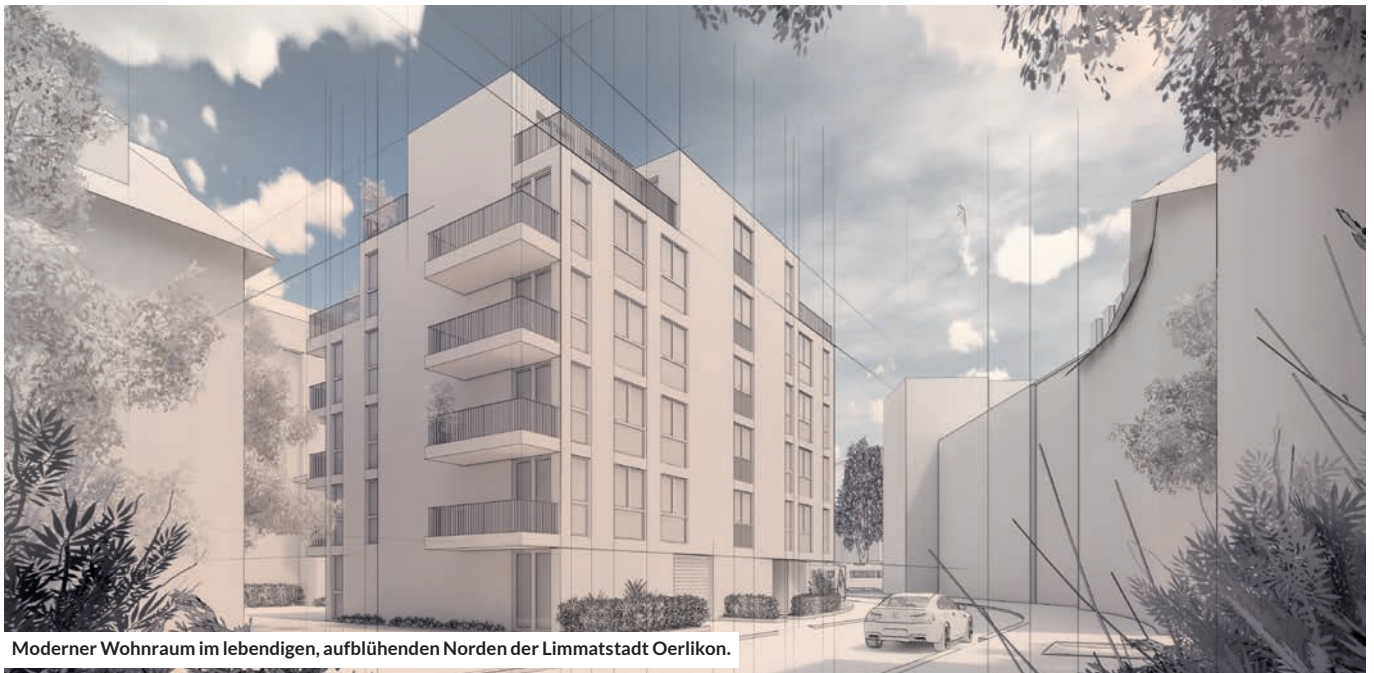
Moderner Wohnraum im lebendigen, aufblühenden Norden der Limmatstadt Oerlikon.