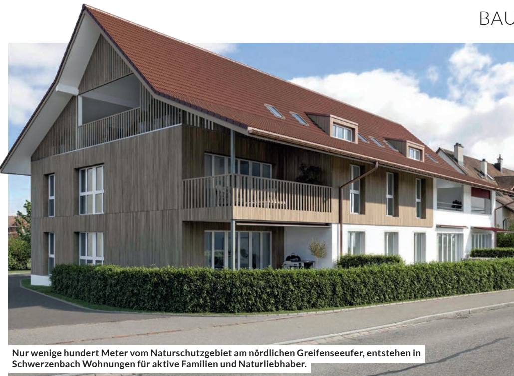
Nur wenige hundert Meter vom Naturschutzgebiet am nördlichen Greifenseeufer, entstehen in Schwerzenbach Wohnungen für aktive Familien und Naturliebhaber.